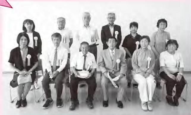
当日、表彰を受けられた皆さま