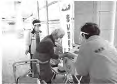
市内スーパー 街頭募金の様子