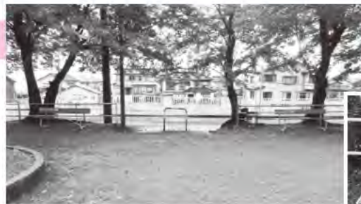
▲浜木浦区 ベンチ2基

社会福祉協議会では赤い羽根共同募金の配分金により、区などが管理している子どもの遊び場へ遊具やベンチを寄贈しています。今年度は浜木浦区にベンチを寄贈しました。