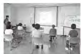
ボランティア講座