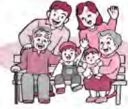
7月8日受付分まで掲載しました。

明星セメント株式会社 総務課様 明星セメント労働組合様 大和川中区 女性部様 有限会社 猪又工業様 有限会社 上谷インダストリー様 有限会社 吉川工務店様 理容スリム様