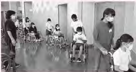
サマワークボランティア