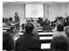
ボランティア講座