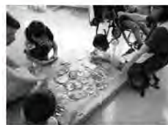
ボランティアフェスティバル