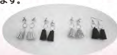
アクセサリづくり