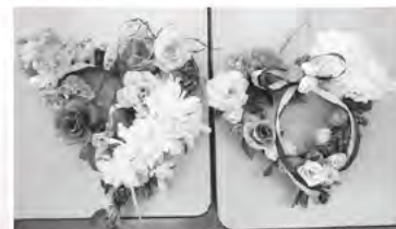
造花でリースづくり