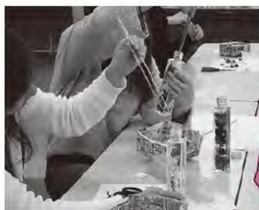
ハーバリウムづくり

次回は12月1日を予定しておりますので、まだ参加されたことのない方もぜひお出かけください。