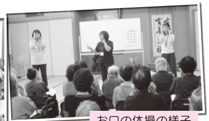
お口の体操の様子