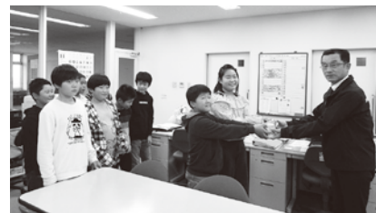
西海小学校の皆さんが募金を届けてくれました

10月1日より実施してまいりました赤い羽根共同募金に対しまして、今年度も市民の皆さまをはじめ、各学校・企業・法人・団体の皆さまから深いご理解とご協力を賜り、大変ありがとうございました。皆さまのあたたかいお気持ちにより、今年度もたくさんの募金が集まりました。実績を下記のとおりご報告させていただきます。